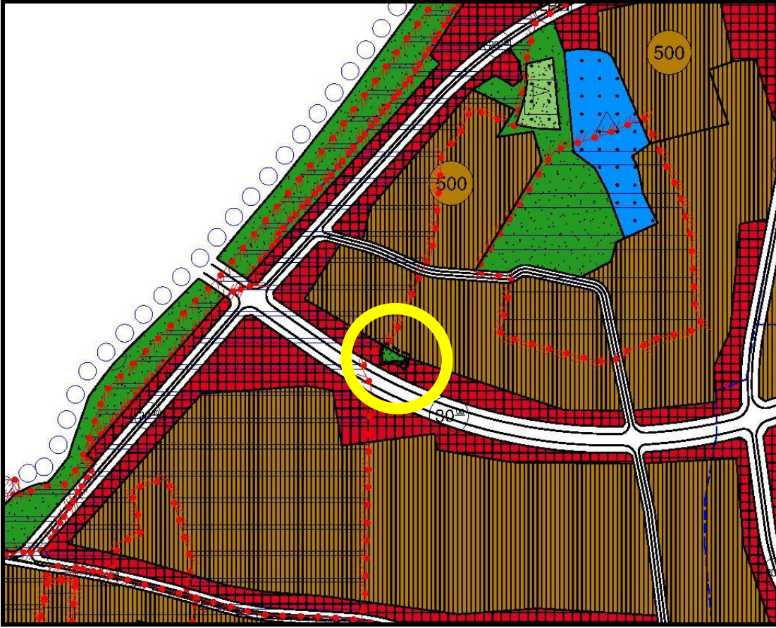
Tablo 1:Arazi Kullanım Tablosu